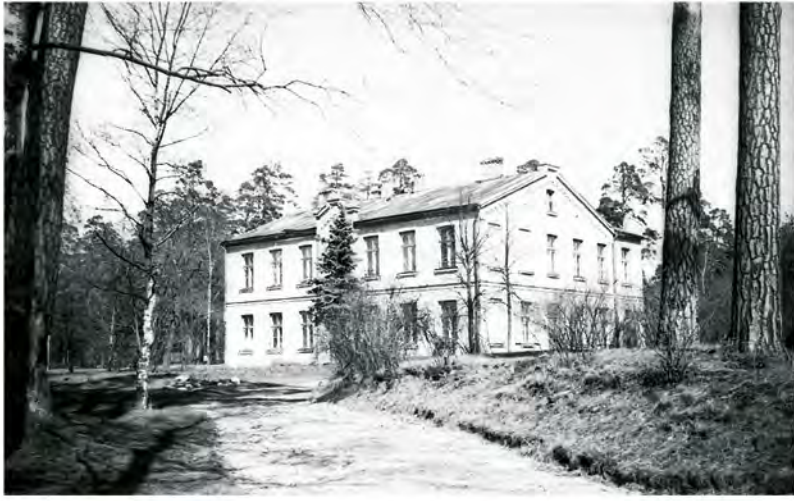
Biķeru 8. gadiņā skola, 1969. gads.