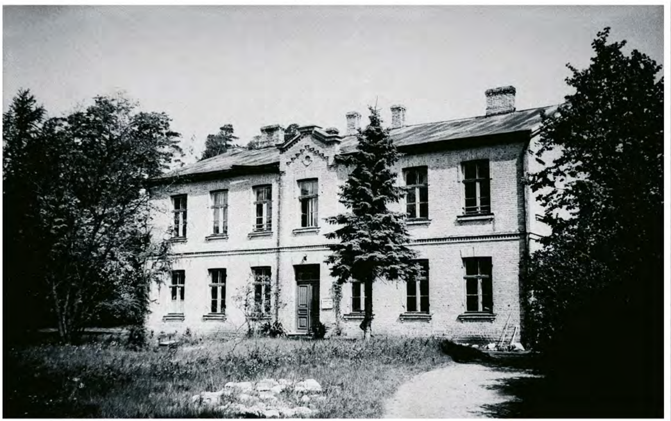
Bīķeru 8. gadīgā skola. 1969. gads.

Divstāvu mūra ēka atradās ainaviski skaistā vidē. No vienas puses, mežs, pati ēka, nedaudz uzkalnā un lejpusē tecēja neliels strauts—upīte. Skolas ēkai bija divas ieejas. Galvenā ieeja bija no priekšpuses, kur bija izveidoti ziedu stādījumi un kuploja ceriņi. No pagalma puses bija t.s. saimnieciskā ieeja, jo šeit atradās neliels šķūnītis, kur atradās malka skolas apkurināšanai. Tur puikas nelegāli uzrāva kādu aizliegto dūmu.