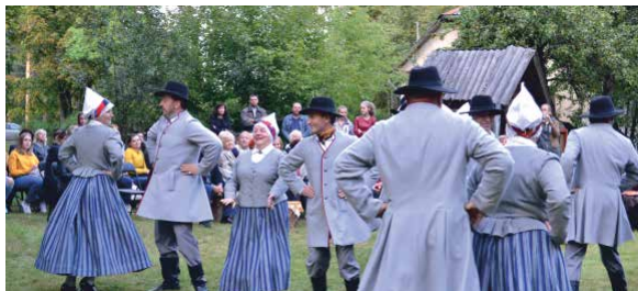
Ulbrokas bibliotēkas jubileja