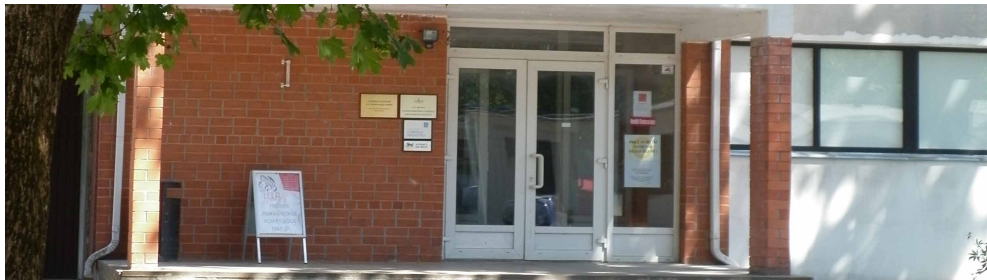
Stopiņu novada Ulbrokas bibliotēka