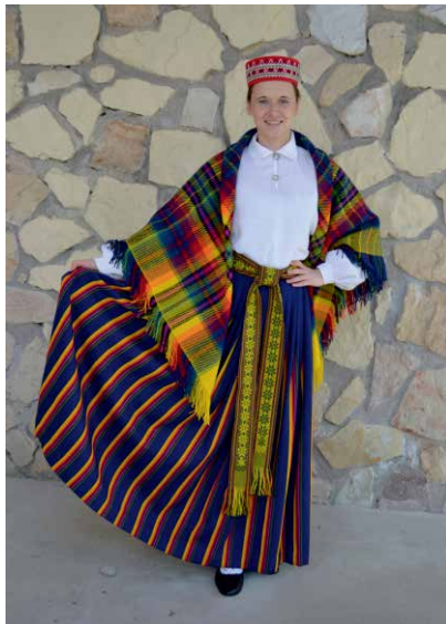
Stopiņu novada tautastērps