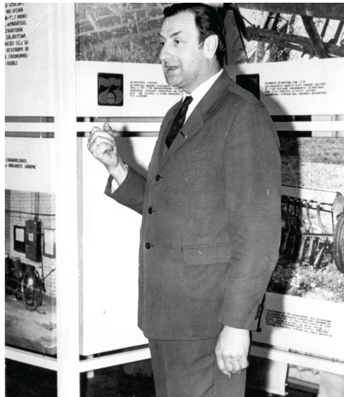
Novada simtgades cilvēks