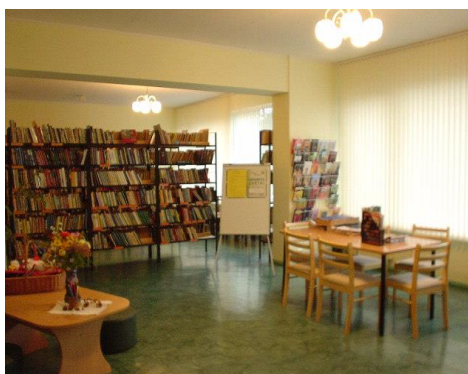
Stopiņu novada Ulbrokas bibliotēkas abonements