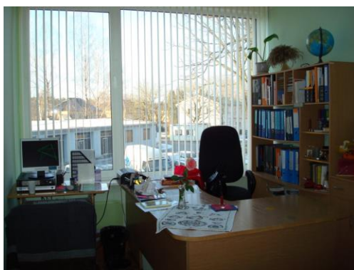
Stopiņu novada Ulbrokas bibliotēkas darba telpa