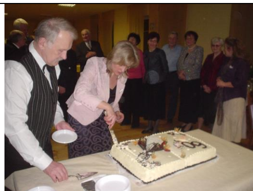
Stopiņu novada Ulbrokas bibliotēkas 60.gadadienas Svinīgs pasākums