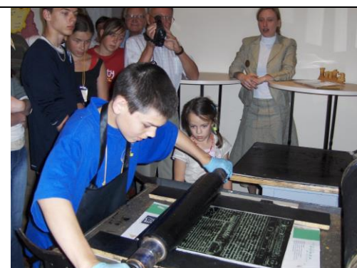
Vasaras ekskursija „Dienvidkurzemes labirinti”