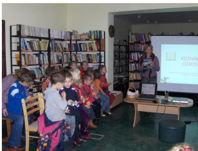
Stopiņu novada Ulbrokas bibliotēkā ciemojas PII „Pienenīte” grupiņas „Lācēni” un „Saulītes”