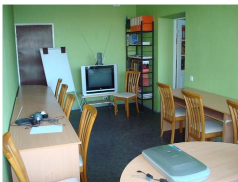
Stopiņu novada Ulbrokas bibliotēkas interneta zāle