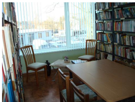
Stopiņu novada Ulbrokas bibliotēkas klusā lasītava